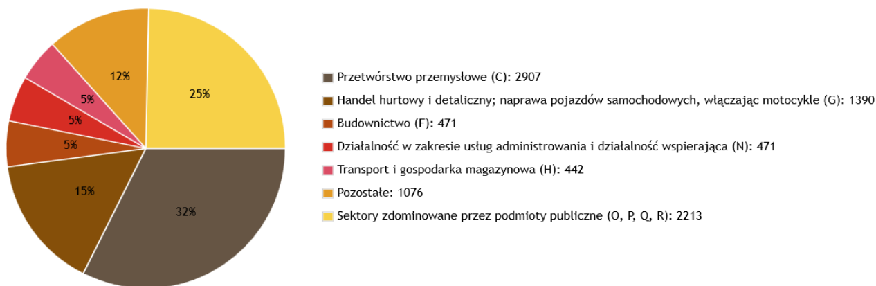
Rysunek 1. Struktura ubezpieczonych według sekcji w gminie Chełmno